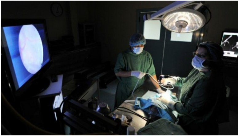
Endoskopie an einem Falken im OP-Saal der Falkenlinik

Doch noch ist das Wunschdenken. Tradition und Moderne liegen dicht beieinander in Abu Dhabi: eines der größten Sonnenkraftwerke der Welt, die Louvre Filiale, das Guggenheim Museum, Ferrari World und gleichzeitig eine patriarchalische konstitutionelle Monarchie ohne Gewerkschaften, ohne Opposition und ohne Regierungsparteien - eines der reichsten Länder der Welt. Auf der anderen Seite die Kultur der Falknerei und ihren Mythen. Margit Müller: