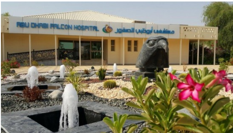
18 Hektar nur für Falken: Eingang zur Anlage der Falkenklinik

"Ich komme hierher ins Falkenhospital, seit es 1999 eröffnet wurde. Die Falken werden von den Ärzten medizinisch sehr gut versorgt, und die Mitarbeiter sind ausgezeichnet.